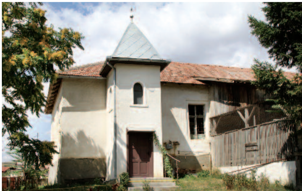
A bálványos református templom

A Kolozsváron tanítói, Budapesten magyar- és történelemtanári oklevelet szerzett fiatal emberben a szibériai fogságban töltött hét nehéz év alatt érik meg az elhatározás, hogy Erdélyben legyen lévita tanító, akinek életcélja „pusztulásra ítélt lelkek megmentése”, „összedőlő templomok felépítése”, „el-némult harangok megszólaltatása”. A megdöbbentő valóság, az elhagyott, nyomorúságos paplak, az úttalan utak, amelyek a fogságban megfagyott lábával nyolc szóránymagyságot kellett megközelítenie, és a fájó közöny sem tudta eltántorítani céljától. Az előadásából, valamint füzetének újrakiadásából származó pénzből Újlakon, Septéren és Nagycégen templomot építtetett, az újlaki templomba bútort faragott, a konfirmáló fiatalokat otthonában gyűjtötte össze, hogy nemcsak a kátéra, írni, olvasni magyarul, történelemre, irodalomra is tanítsa őket. Elkéséredésében megfogalmazott írása nemcsak panasz, a tennivalók felsorolása is: a szóránymagyságot az egész közösség terhe kellene legyen, és lelkes, önfeláldozó emberekkel meg kellene alakítani a szóránymagyságot.