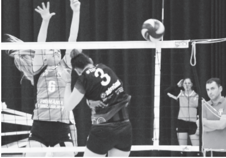
Csak a nyitósztetben tudott ellenfele fölé nőni a fiatal marosvásárhelyi együttes.