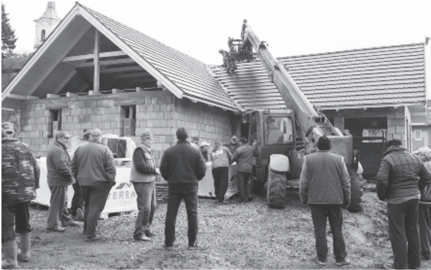
Négy hónap alatt sikerült felépíteni a ravatalozót – a befejezés a jövő évre marad

Az egyesület a ravatalozó megépítésére a két temető közelében, az út mellett fekvő „kántori kert” területén a legmegfelelőbb helyszínen, ezért öt ár területet igényeltek itt a tulajdonos unitárius egyházközségtől. Miután minden beleegyezést megszerzett, az unitárius gyülekezet 49 évre ingyenes használatra átadta a helyet az egyesületnek az építkezés céljából. A július 2-i falugyűlésen ígéret hangozott el, hogy az épület még az idén tető alá kerül a közösség összefogásából: minden 18. életévét betöltő személy 100 lejtel, a munkabíró férfiak ötnapi közmunkával kötelesek hozzájárulni, míg a nők vállalták a férfiak étkeztetését minden munkanapon. A helyiek nem igazán hitték, hogy lehetséges az első lépés ilyen rövid határidőn belül, de július derekán elkezdődött a munka, és négy hónap elteltével az épület tetőzetére felkerült a virágcsokor is. Mindez úgy, hogy a legtöbb férfi csak hétvégente tudott munkára menni, hétköznapokon csak alig dolgoztak.